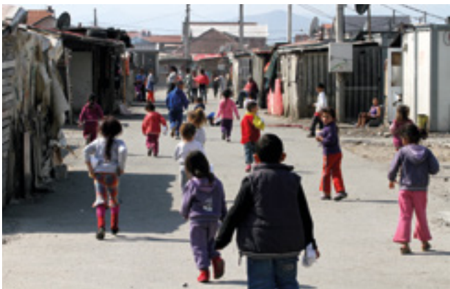
Deca u Konik kampu

Imajući za dugoročni cilj zatvaranje naselja Konik, Vlada je pokušavala pronaći sredstva za trajno stambeno zbrinjavanje njegovih stanovnika. U septembru 2014. godine, Evropska komisija je preko IPA 2007-2013 započela izgradnju 50 stanova i društvenog centra za stanovnike naselja. Preostale porodice će biti zbrinute kroz RSP, u okviru Državnog stambenog projekta u Crnoj Gori, za koji su planirani projekti u ukupnoj vrijednosti od 27 miliona eura. RSP predviđa izgradnju 120 stambenih jedinica, a rok za početak je druga polovina 2015. godine, čime će se omogućiti konačno zatvaranje naselja Konik i novi život za njegove stanovnike. Ukupni procijenjeni troškovi ovog projekta su 6,7 miliona eura, od čega je 6,2 miliona obezbijedeno iz sredstava Fonda RSP. Rad na uklanjanju kontejnera, aktuelnog smještaja za sadašnje stanovnike, u toku i uskoro će biti okončan.